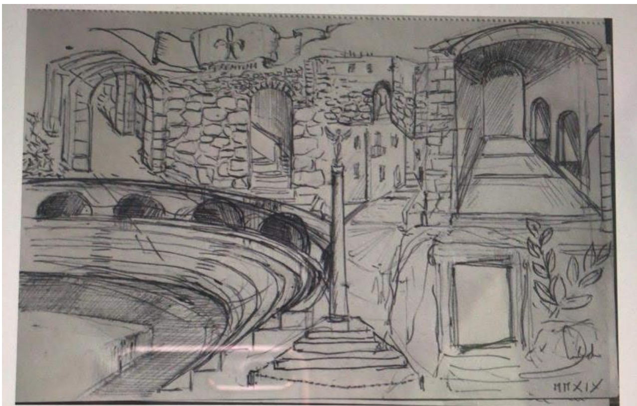
PROGETTO MURALES (FOTO 2)

Altra attività è stato il concerto di Natale che ha visto coinvolti nell'orchestra della scuola media, gli alunni di classe quarte e quinte con il suono del loro ukulele contornati dai canti degli alunni delle altre classi.